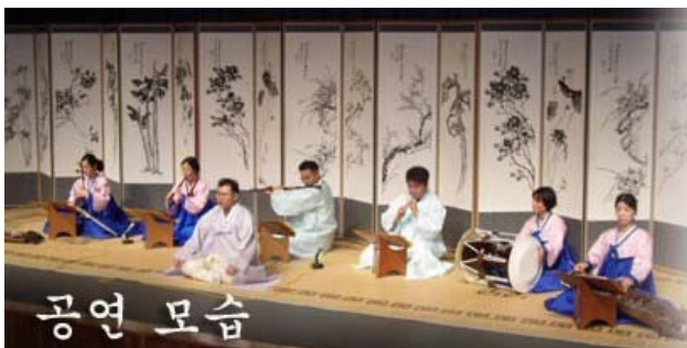
Koreanische Traditionsmusikgruppe Poong Ryu Hoe