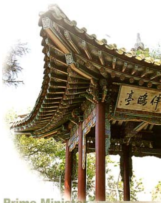
Prime Minister Hwang-Hui Remains